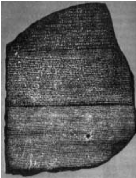
羅西塔石，目前保存在英國博物館。為考古學上的重大發現。

「彈性係數」的觀念，在材料科學上是很重要的貢獻，但是，楊格卻有更深的體會。他在研究論文上寫道：「物理最後的發展，會回到最基本又不可分割的微小粒子上，那是物質的最小單位。然後，物理學家會發現那微小的粒子，彼此之間仍會有作用力，不是這些微小粒子產生的，因為微小粒子裡還有更微小的粒子，無論人怎樣將粒子細分，仍會有作用力，不是這更小的粒子所產生的。所以物理學最終的思索是，這些作用力是怎麼來的？無論是從電、從磁、從光、從熱、從萬有引力，從任何方面去切入，最後都會回到這一個問題，人類沒有辦法解釋最基本的的作用力，為什麼不是基本粒子所產生的？我好像一個探險家，跋涉過最茂密的森林，最後才承認所見的仍是影兒，不是本物的真相，真相是永存的，是非物質的，是屬靈的。」