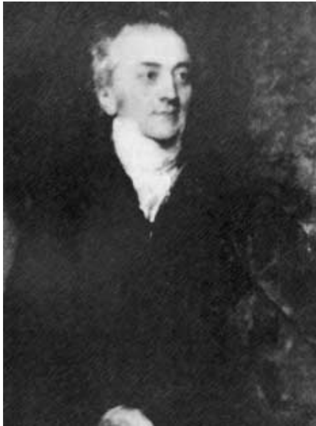
楊格是個醫生、教育家、科學家、經濟學家、考古學家、語言學家、物理學家，但卻自稱一生還沒學會的兩門功課，是每天在合適的時間起床，與在合適的時間上床睡覺。

一八七年，楊格更在「有用知識推廣協會」的小冊上發表後來非常著名的「楊氏彈性係數」(Young's elastic modulus)。不同於「虎克彈簧」，楊格認為物體的受力不只受到重量的影響，也受到衝撞速度的影